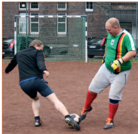
Voller Einsatz, auch beim Training