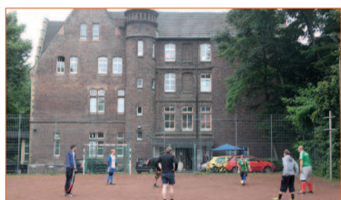
„Schweinchen“ spielen zum Aufwärmen