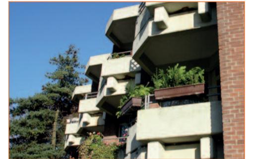
Im Umbruch: die Caritas-Pflegeheime