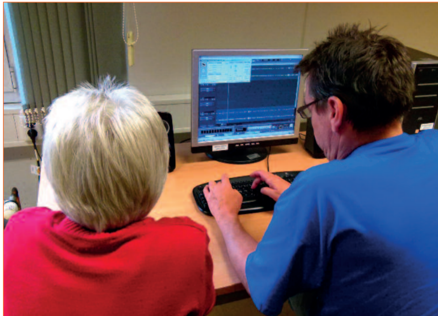
Redakteure von Radio50+ helfen bei technischen Fragen