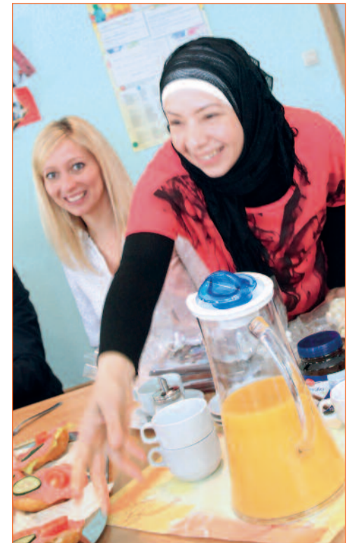
Viele Flüchtlinge bringen eigene Spezialitäten mit