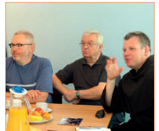
Gemeinde St. Josef: mit Rat und Tat dabei