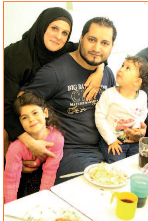
Die geflüchteten Familien ...