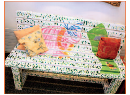
Lädt zum Austausch ein: Erzählbank im Haus St. Anna