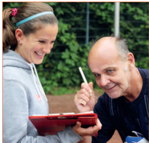
Vor jedem Spiel: Unterschreiben der Fair-Play-Regeln