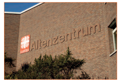
Schon bald: neue Konzepte im Haus St. Anna