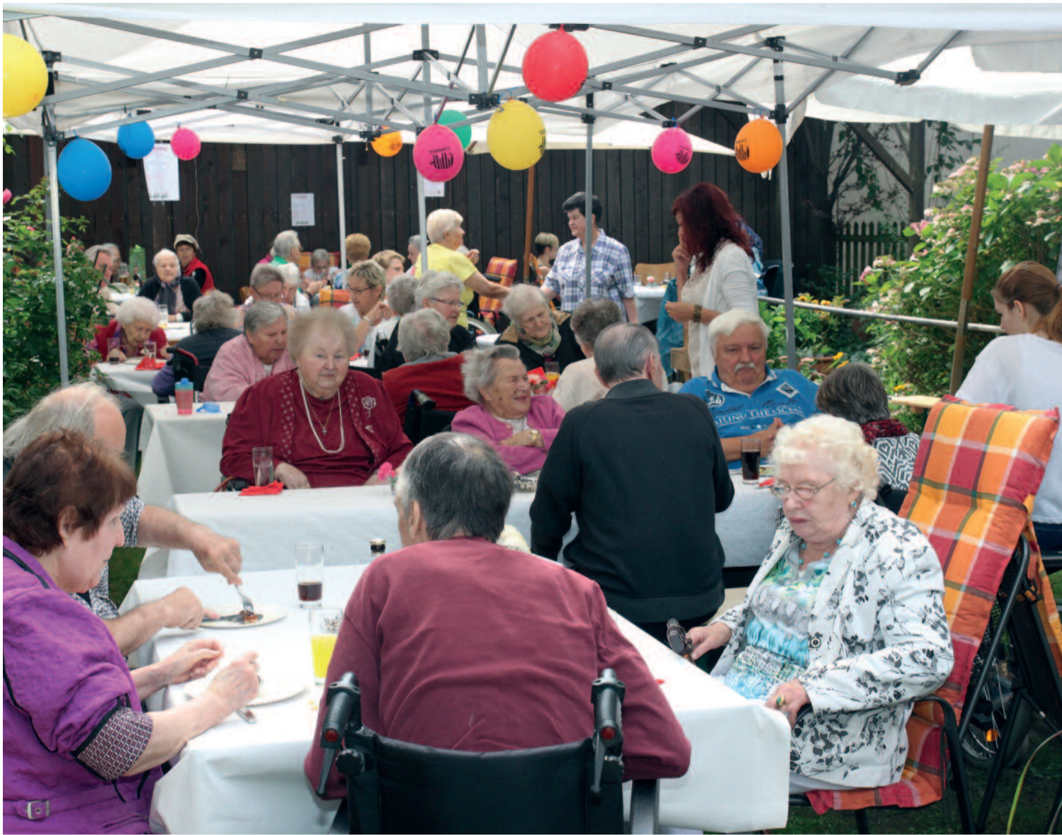
Sommerfeste verbinden: hier im Liebfrauenstift