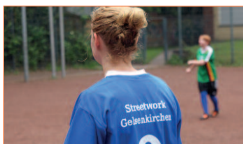
Einheitliche Trikots für alle

Es regnet. Trotzdem stehen acht Männer und Frauen auf dem Platz vorm Wilhelm-Sternemann-Haus und kicken sich den Ball zu. Sie gehören zur Mannschaft vom Fußballprojekt für wohnungslose und suchterkrankte Menschen.