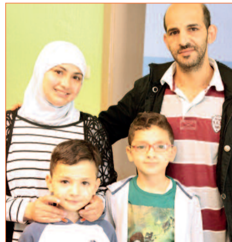
... fühlen sich hier wohl