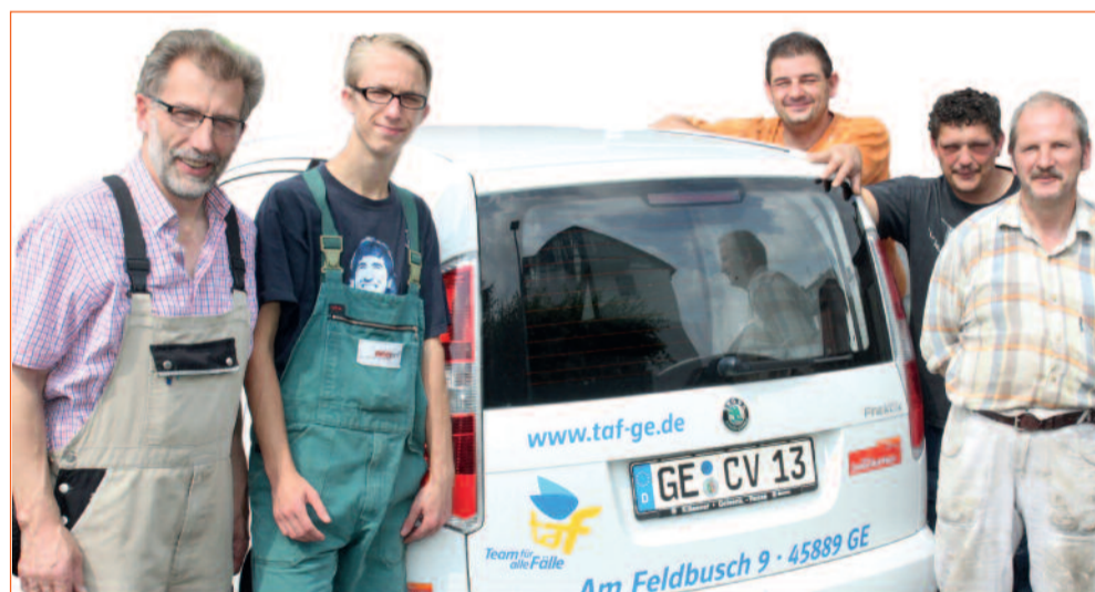
TAF-Team für alle Fälle gGmbH – Am Feldbusch 9 – Tel.: 0209 / 380 682 710

Damit auch im Winter weitertrainiert werden kann, sucht die Mannschaft noch Spenderinnen und Spender, die Besuche in der Soccerworld Gelsenkirchen, einem Indoor-Fußballplatz, fördern – denn bei Wind und Wetter muss keiner mit der Mannschaft mehr draußen sein. ■